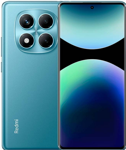
Telemóvel Xiaomi Redmi Note 14 Pro 4G 6.67 256Gb 8Gb de Ram Ocean Blue